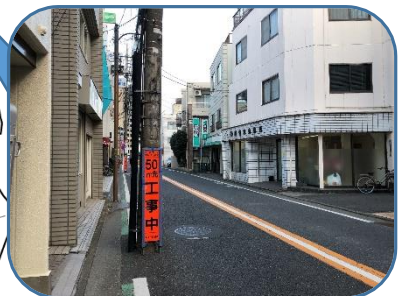
保谷新道 東京都が優先的に無電柱化を検討している路線 早期整備を求める