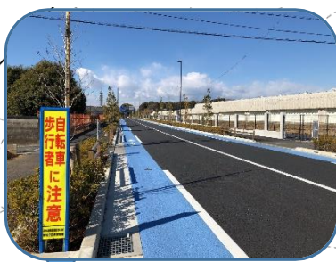
3・4・9号線と東大農場通りの交差点に横断歩道を要望