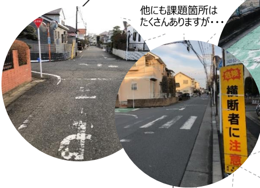
他にも課題箇所はたくさんありますが...

令和4年度中に、LINEにより道路や公園の不具合を画像で報告するしくみができる予定です。