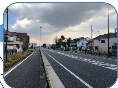
北町5～6丁目の3・3・14号線500mにわたり横断歩道がない