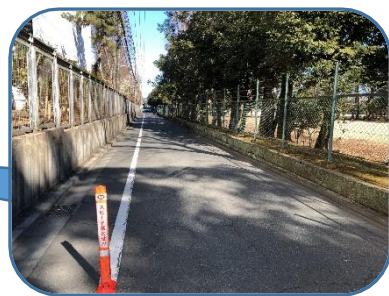
MUFGパークの北側・西側には銀行側が一定の歩行空間を確保すること

令和4年度中に、LINEにより道路や公園の不具合を画像で報告するしくみができる予定です。