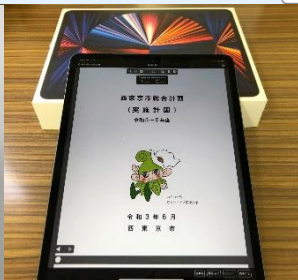
タブレット端末の試行導入