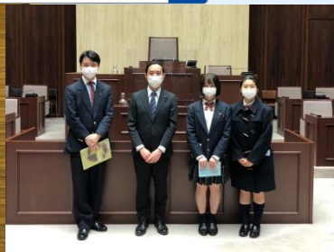
高校生インターンシップ受け入れ