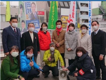
11人の議員団による街頭リレートーク