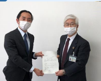
教育長にオンライン授業等の要望提出