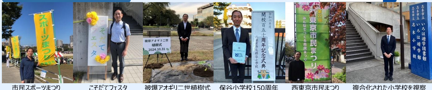
市民スポーツまつり