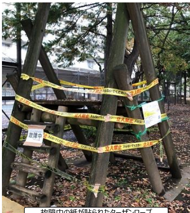
故障中の紙が貼られたターザンロープ

例えば、子どもがど真ん中のまちづくり。考え方は決して否定しませんが、現場に十分浸透しているのかと言えば、 まだまだ課題がある と思います。