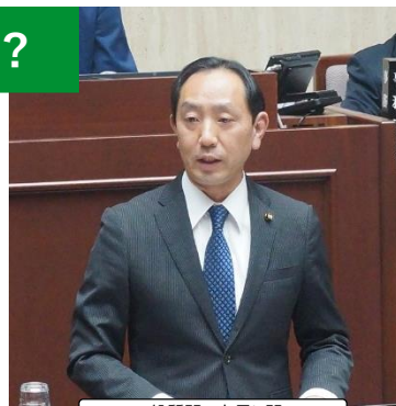
一般質問で市長に問う

むくのき公園と谷戸せせらぎ公園で、ふりがなやイラストの入ったわかりやすい掲示が追加され、児童館と連携した説明会も開かれるなど一定の改善がなされましたが、 なぜ最初からできなかったのか と残念に思います。