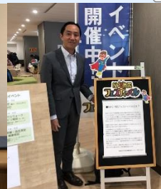
NPO市民フェスティバル