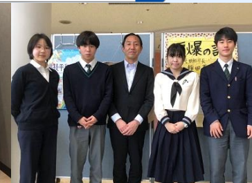
高校生インターンシップ受け入れ