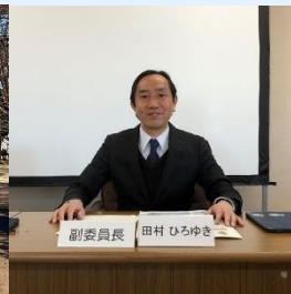
広報委員会副委員長を続投