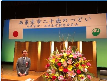
西東京市二十歳のつどい