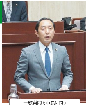
一般質問で市長に問う

さて、2期目最初の予算審査が行われた3月議会は 異例の展開 でした。上記で説明した給食調理業務委託の入札不調による予算の訂正や、答弁の訂正・調整のために度々委員会がストップし、予算特別委員会を計3日以上開催できませんでした。また、議会への報告が遅い案件も多数ありました。こうした事態を議会としても重く見て、本会議最終日に議員全員の名前で「 幹部職員の職務遂行に関する決議 」を提出し、可決しました。