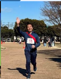
リレーマラソン大会